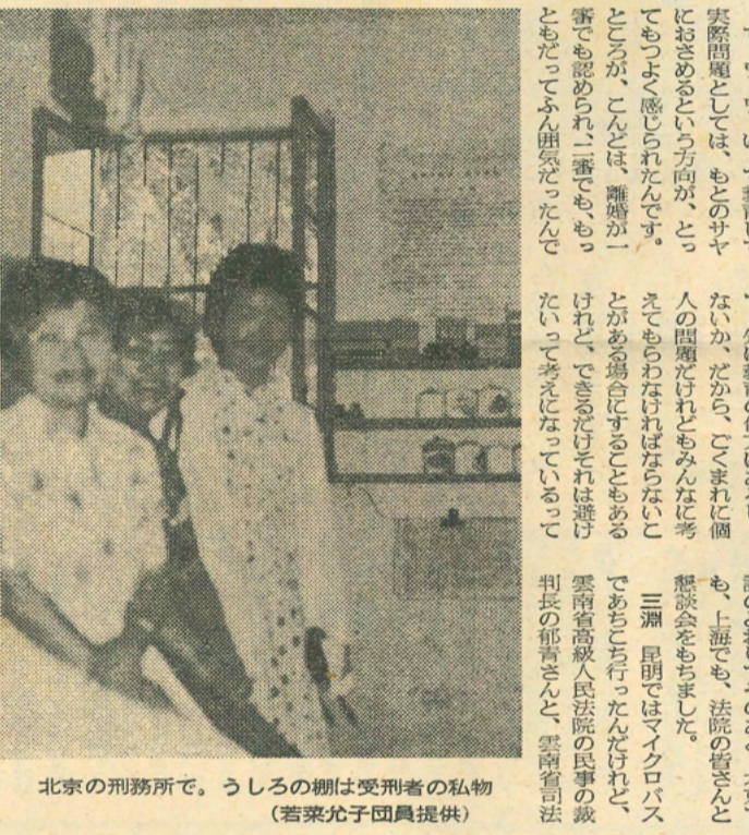
北京の刑務所で。うしろの欄は受刑者の私物

三浦 そうですね、男の子に、あな何になりたいか、ってきくと、数学が好きだ、というの、そして、数学が好きなんで、よほど頭がいいんじゃないか、って聞くと、その子、「ハイ、ハイ」というの(笑)。